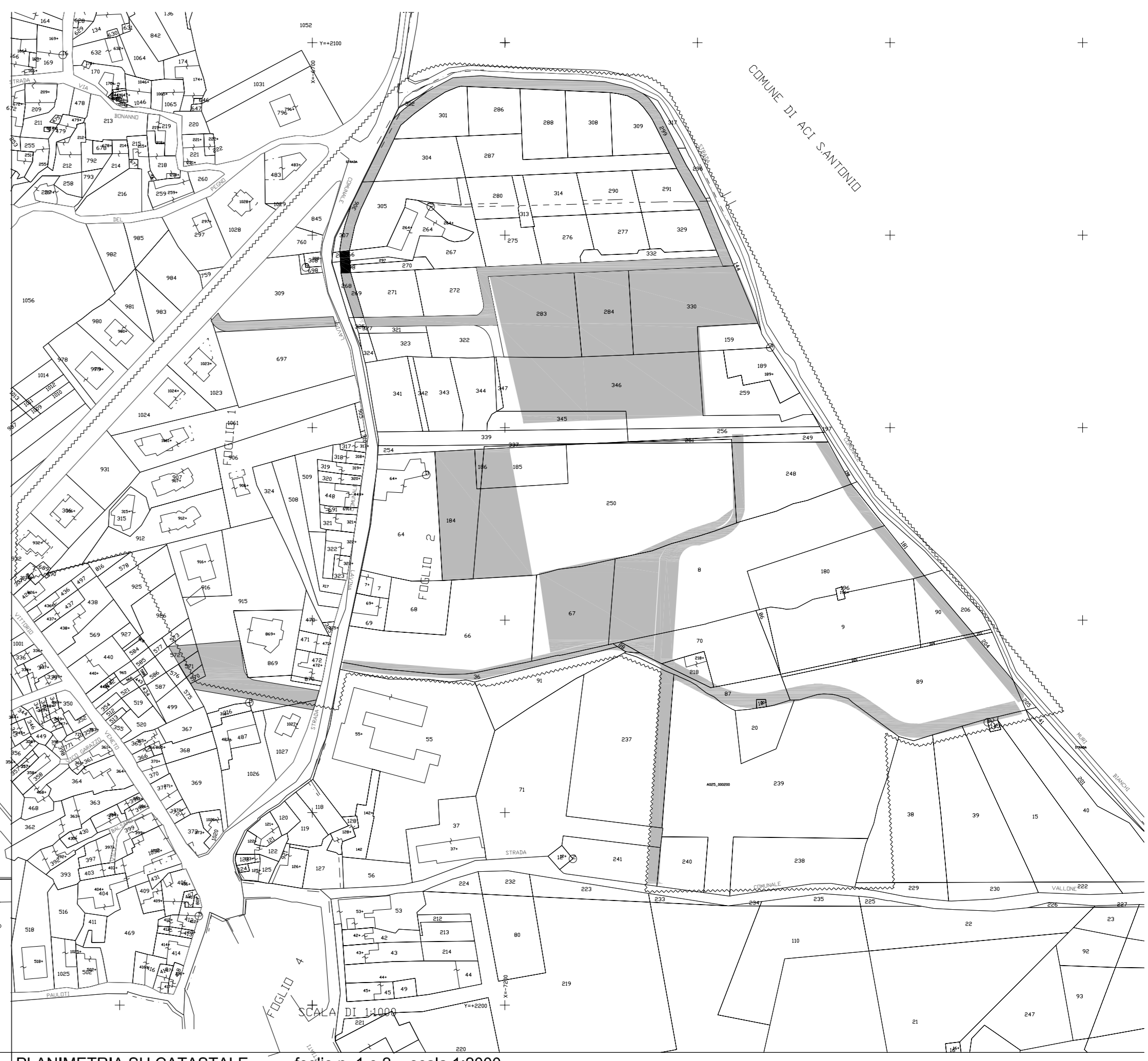
PLANIMETRIA SU CATASTALE foglio n. 1 e 2 - scala 1:2000