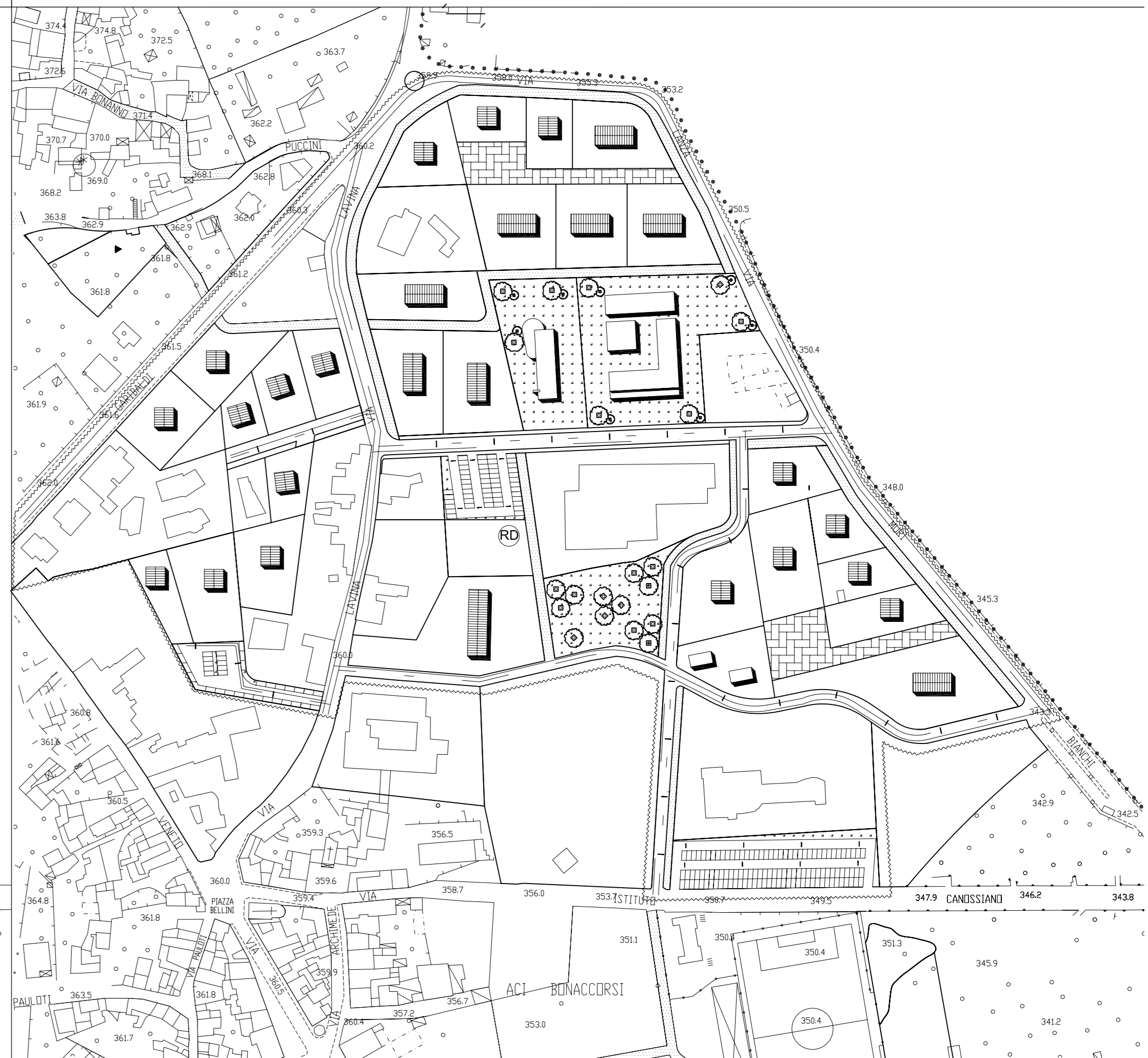
IMPIANTI A RETE: linee idrica e fognaria - scala 1:2000