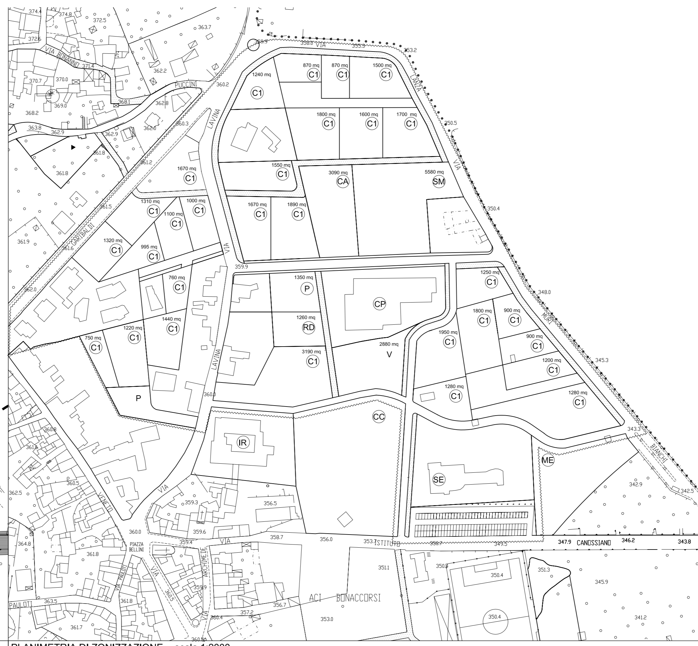
PLANIMETRIA DI ZONIZZAZIONE - scala 1:2000