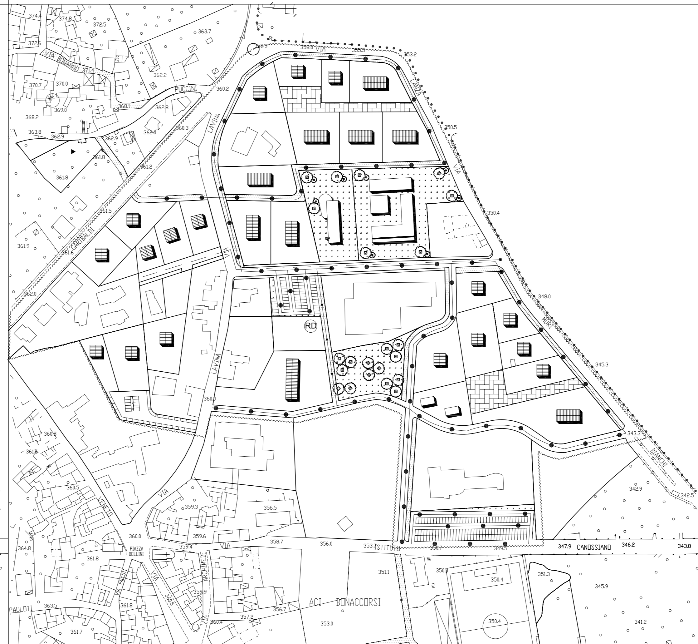
IMPIANTI A RETE: linee elettrica e telefonica - scala 1:2000